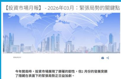
【投資市場月報】- 2026年03月：緊張局勢的關鍵點